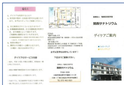
パンフレット表面