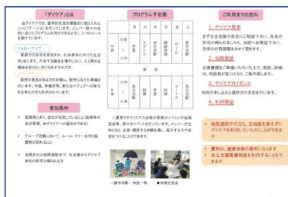
パンフレット裏面